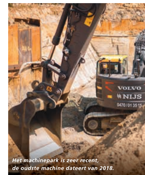
Het machinepark is zeer recent, de oudste machine dateert van 2018.

bestaat er niemand die zijn job liever doet dan zijn vader: "De zeldzame momenten dat we niet werken, vinden we hem altijd terug op onze depot, in zijn kraan, grond te verzetten."