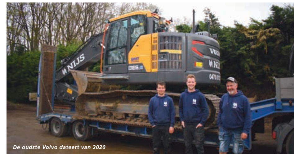
De oudste Volvo dateert van 2020